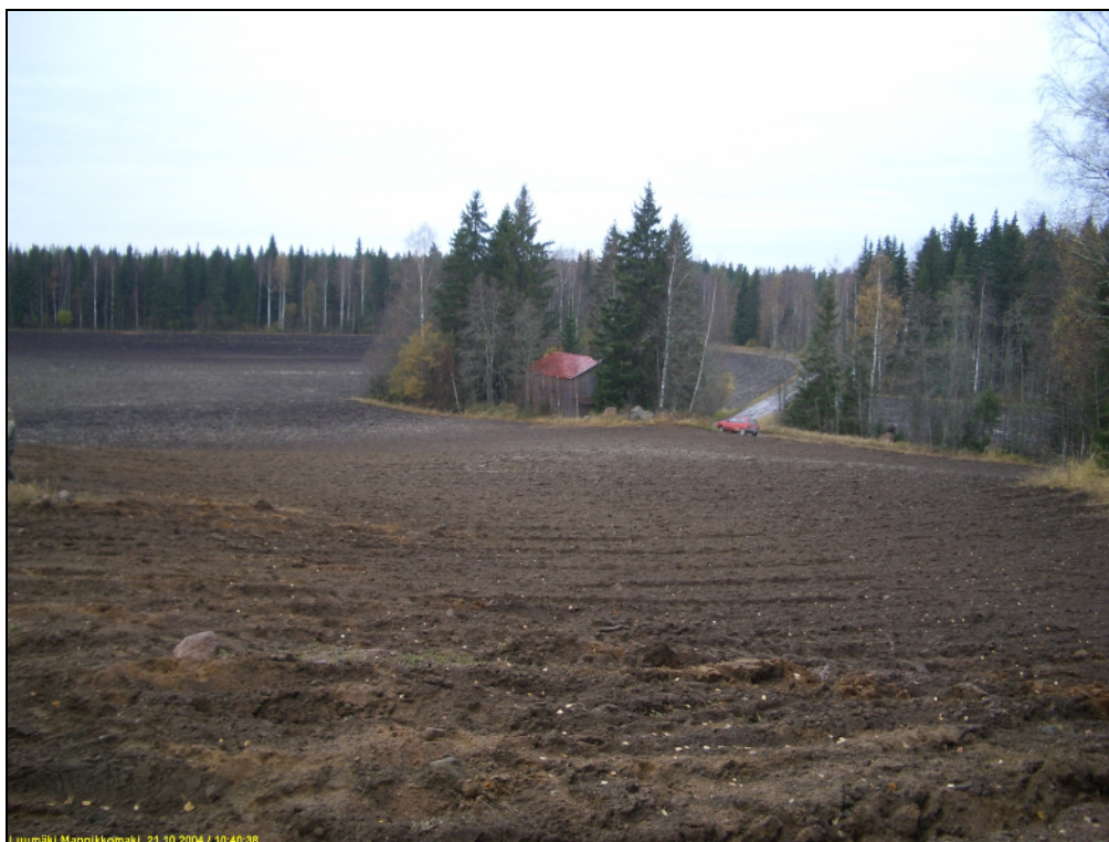
Rinteen alla on toinen asuinpaikka ladon edessä. Kuvattu luoteeseen. Alla: kuvattu rinteen laen suuntaan sen alta etelään.