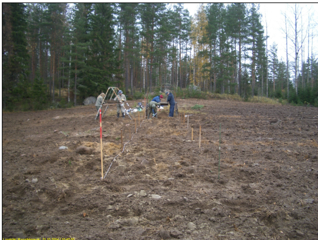
Peltoa seulotaan. Kuvattu itään.

Kiintopistekivi (laki Rostedtin käden kohdalla 60,09 m) tien laidalla. Kuvattu luoteeseen.