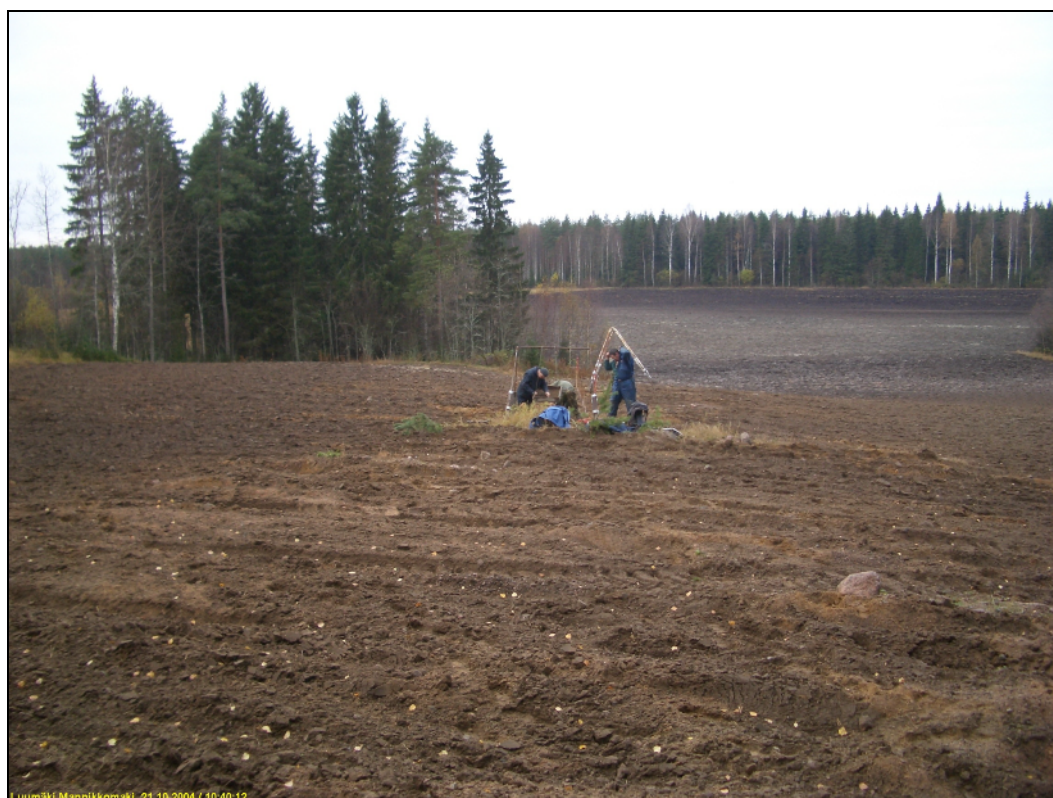
Asuinpaikan aluetta, kuvattu länteen.