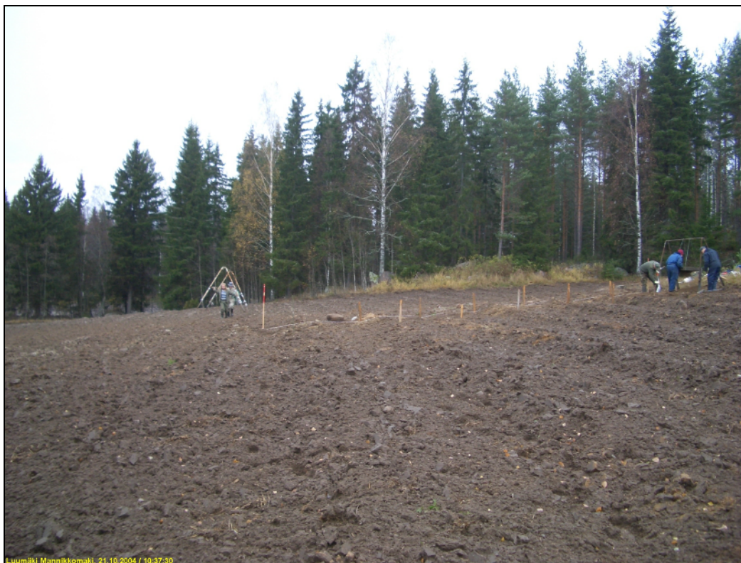
Seulottavaa aluetta valmistellaan. Kuvattu pohjoiseen.